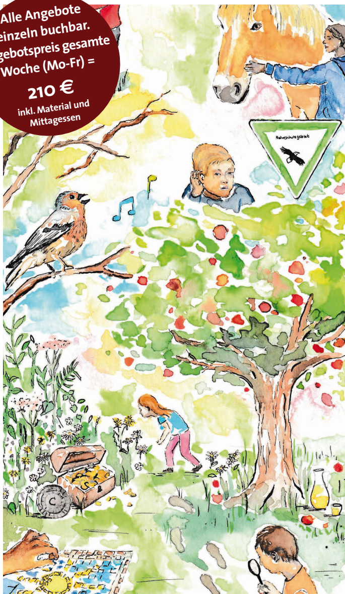
Illustrationen: Dana Pfeiffer

Alle Angebote einzeln buchbar. Angebotspreis gesamte Woche (Mo-Fr) = 210 € inkl. Material und Mittagessen